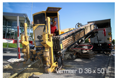
Vermeer D 36 x 50 II