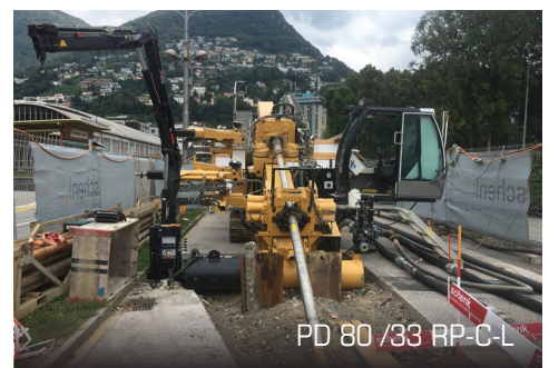
PD 80 / 33 RP-C-L