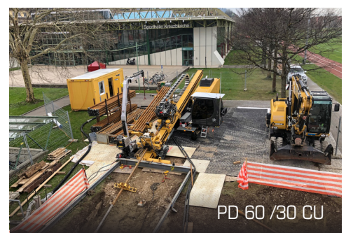
PD 60 / 30 CU