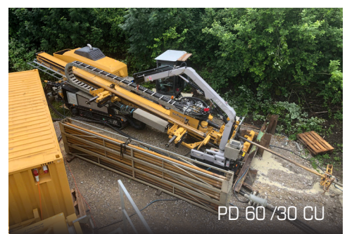
PD 60 / 30 CU