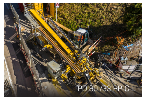
PD 80 / 33 RP-C-L